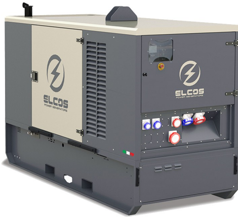
Imagine cu scop demonstrativ